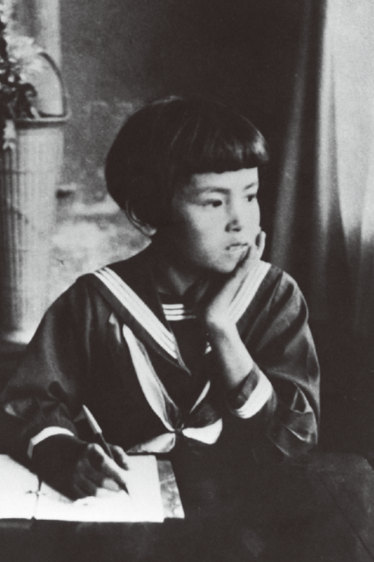
小学校4年生の頃。福井市の自宅にて。