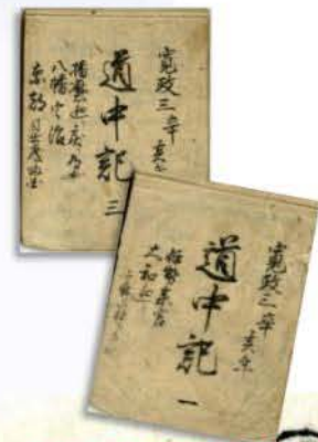
道中記／吉野屋文書