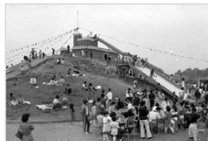
運動公園(子供の国) 昭和55年 69598