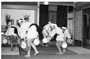
上中町六斎念仏 昭和44年 64117