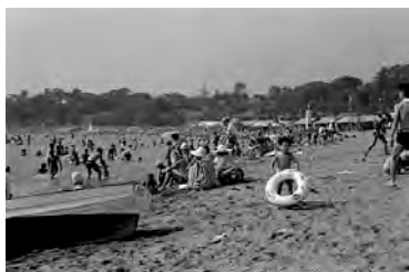
三国海水浴場 昭和39年 62064