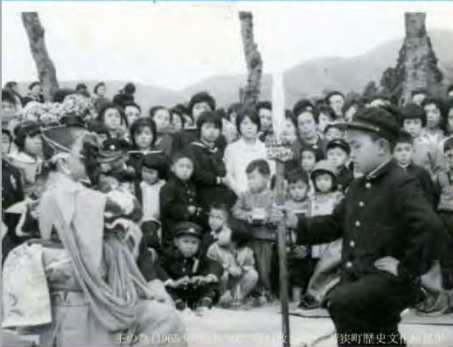
壬子年白河の賑わい