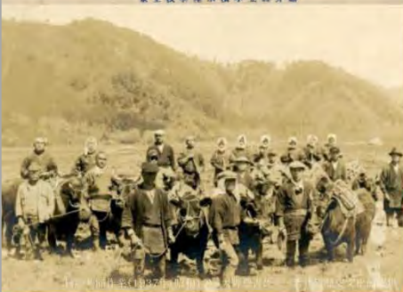
若狭の馬(1957年(昭和32) 山本五次郎、福井県立若狭歴史文化館提供)