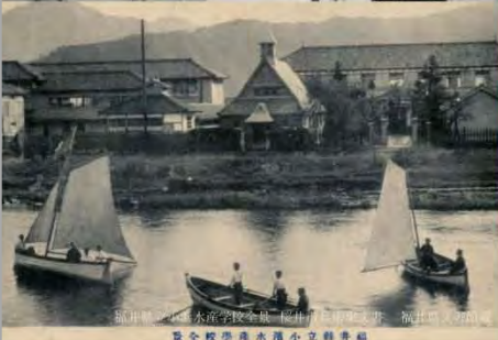
福井県立若狭歴史文化館