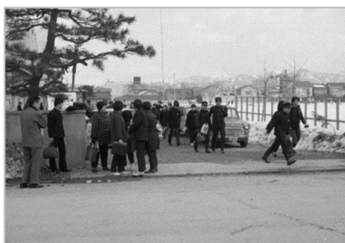
▲高校入試 昭和43年 63401