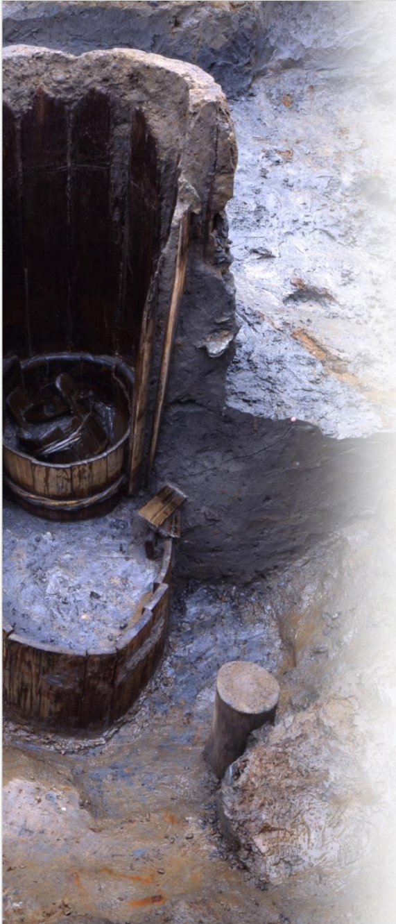
福井城 井戸断面

そのなかで日常的に使われていた漆の椀や下駄、包丁などを、そこで暮らした福井藩士の資料とともに紹介します。