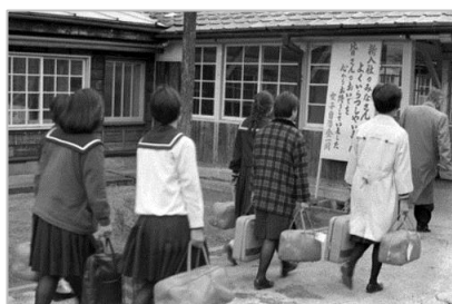
▲鹿児島県からの集団就職者 昭和41年 78589