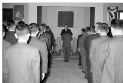
▲新規採用教員辞令交付式 昭和43年 63437