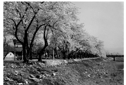
▲勝山市弁天桜 昭和39年 61490