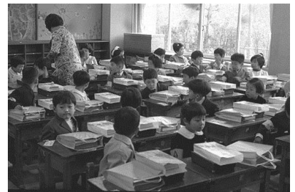
▲入学式 昭和44年 63900