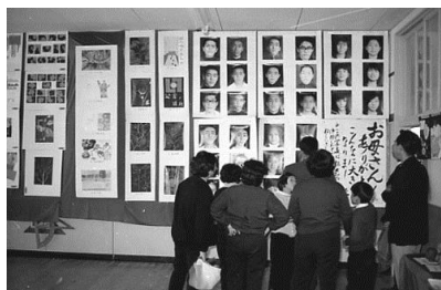
▲宮崎村文化祭 昭和45年 64810