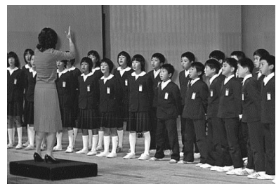
▲福井市小学校音楽大会 昭和56年 68685