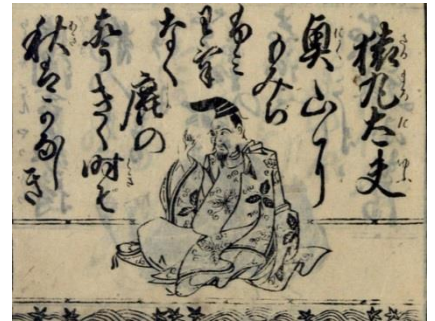
▲部分(読みは下にあります。)