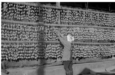
▲つるし柿(今庄町) 昭和41年 62834