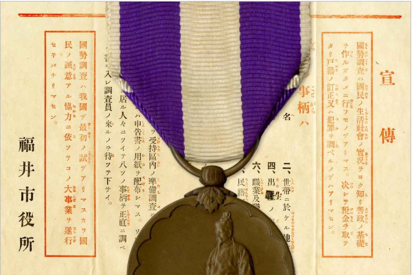
国勢調査チラシ 国勢調査記念章 加藤竹雄家文書