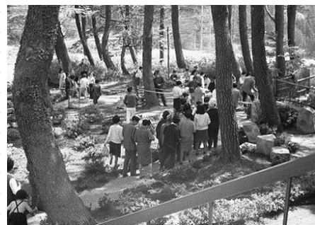
ゴールデンウィークでにぎわう奥越高原 昭和44年 63949