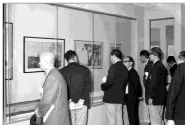
▲明治百年記念展 昭和43年 63688