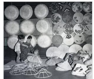
▲丹生郡清水町杉谷(すげ笠) 昭和35年 60514