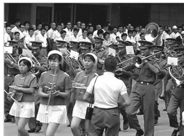
▲中高生 国体記念吹奏パレード 昭和40年 62375