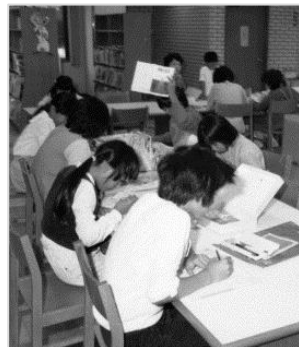
▲県立図書館 昭和57年 79341