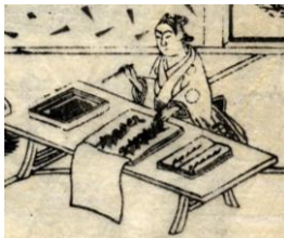
▲『童子初学富貴用文世海蔵』 桜井市兵衛家文書(当館蔵)

白川文字学の室リニューアルオープンにあわせた、江戸時代の漢字学習に関する展示です。