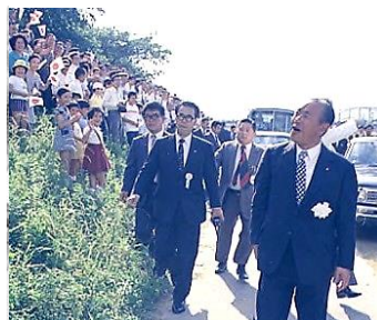
▲田中総理来福 昭和49年6月26日 66918