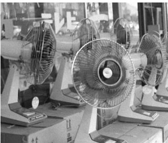
▲夏を呼ぶ(風鈴、扇風機) 昭和42年6月5日 63057