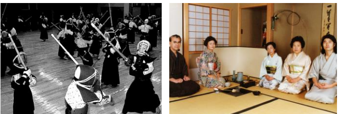
▲寒げいこ(武道館) 昭和49年1月16日 67076 ▲陶芸館 昭和55年1月19日 80318

■文書館■ 〒918-8113 福井市下馬町51-11 電話：0776-33-8890 ファクス：0776-33-8891 メール：bunshokan@pref.fukui.lg.jp 開館時間：午前9時~午後5時 ■フレンドリーバス(無料)をご利用ください■