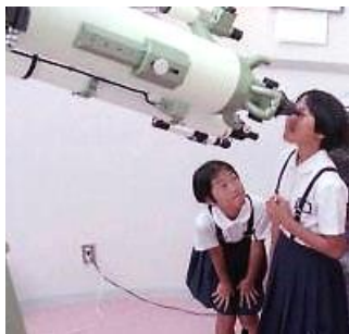
▲河野村の天文台 平成4年8月18日