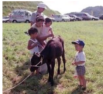
▲若狹牛モウモウまつり 平成4年8月23日