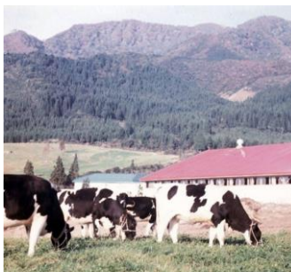
▲奥越高原牧場 昭和45年10月23日