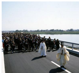
▲三国大橋開通 昭和56年10月17日