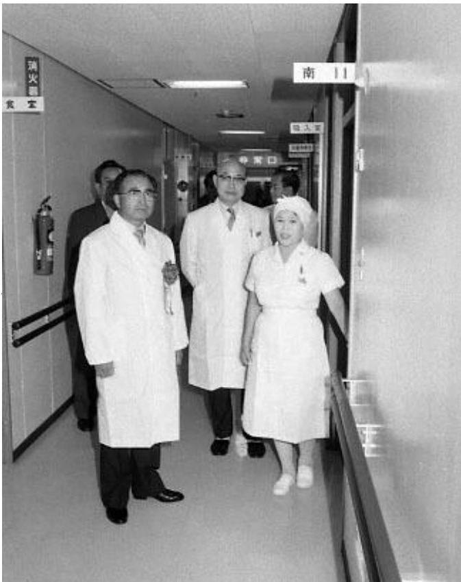
▲「救急の日」昭和57年9月9日