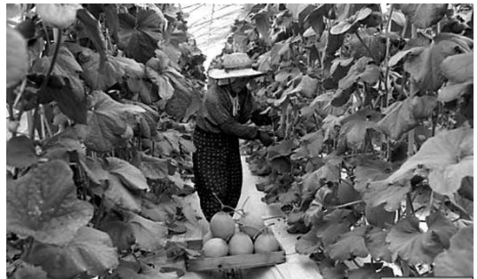
▲「メロン 勝山市若猪野」昭和56年9月28日