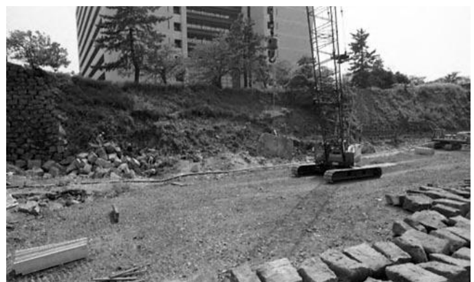
▲「福井城の石垣修復」昭和57年9月1日