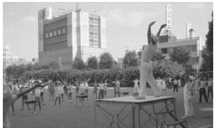
▲「順化ラジオ体操の会」昭和48年8月21日