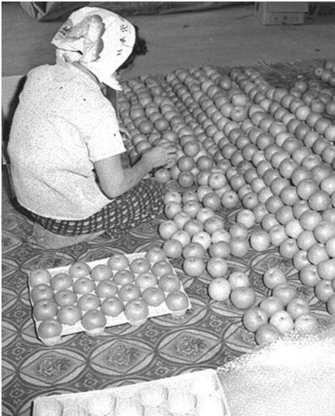
▲「梨の選別 三国町加戸」昭和48年8月30日