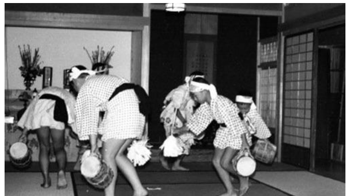
▲「上中町六斎念仏」昭和44年8月13日