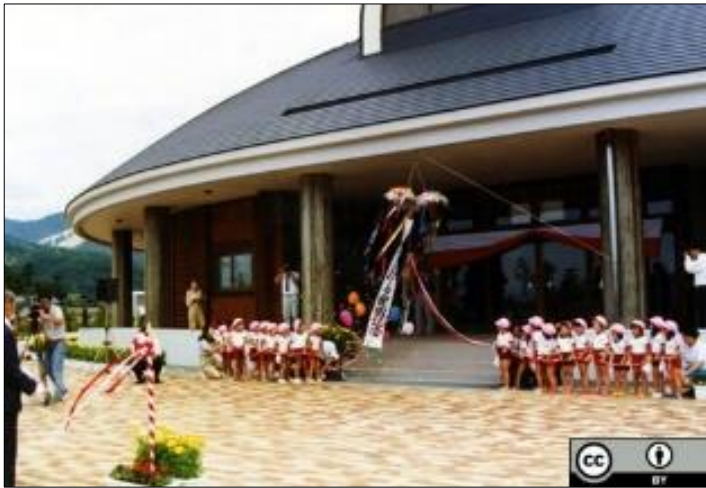
平成4年8月 写真番号79135 (福井県：広報) (グリーンセンター内) グリーンパークの開所式