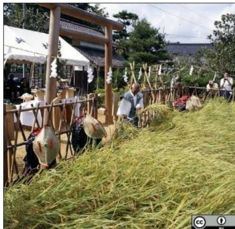
昭和55年9月 写真番号68064 献穀拔穂式