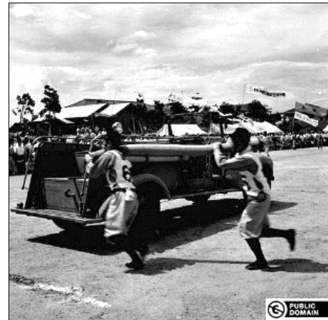
昭和30年8月 写真番号60354 北陸3県消防競技