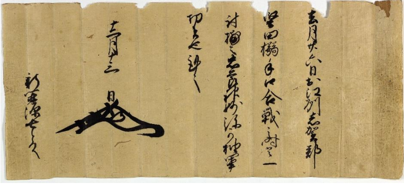
1570年（元亀元）「(朝倉義景感状)」片岡五郎兵衛家文書（当館寄託）

【翻刻文】 去月廿六日於江州志賀郡 堅田搦手口合戦之時、首一 討捕之、忠節神妙、弥可抽軍 功者也、謹言、 十二月十三日 （花押） 新開源七殿