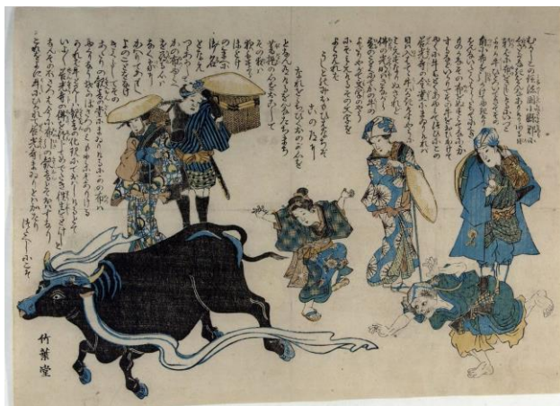
「牛に引かれて善光寺参りの図」(竹葉堂) B0037-00614 勝見宗左衛門家文書 (当館蔵)

今年は新幹線で江戸まで旅をする人も多いかな。江戸時代の人々の旅の様子も当館にてご覧あれ。