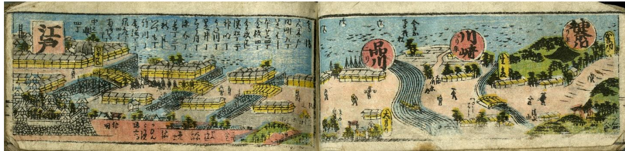
彩色された東海道の道中図。宿駅間の距離も記載されている。