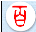
できあがりのイメージ 古代文字「百」