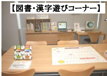
【図書・漢字遊びコーナー】

白川博士が書庫と称した書齋を復元して展示中！ 机とともに、文房具や茶碗、杖等の様々な遺愛品もあわせて展示しています。