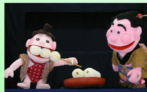
「だんごどっこいしょ」