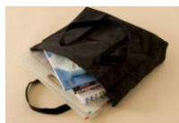
B賞 貸出用バッグ【100名】