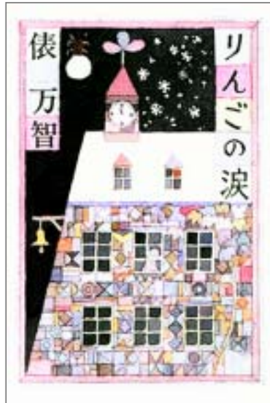
「りんごの涙」俵万智 文藝春秋/1989年 藤島高校時代や「家族への葉書」のエピソードが綴られている

時に武生市(現・越前市)に転居、武生第一中学校と藤島高等学校に通うなど、多感な時を福井県内で過ごしました。早稲田大学第一文学部に進学してからは短歌を作り始め、佐佐木幸綱氏に師事しました。1987年に第一歌集『サラダ記念日』を出版すると、その新しい感覚が話題を呼び、大ベストセラーとなります。また2006年には『プーさんの鼻』で第11回若山牧水賞を受賞しました。