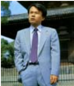
「週刊文春 1981年 4月23日号」より

平成 14(2002)年 12月に福井ゆかりの直木賞作家・有明夏夫氏が亡くなってから、今年で5年という節目の年を迎えました。