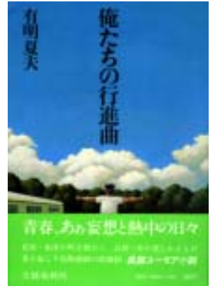
「俺たちの行進曲」有明夏夫 文藝春秋刊/1981年