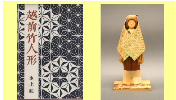
著書『越前竹人形』の表紙とヒロイン・玉枝の竹人形 物語の中で、玉枝が初めて喜助の家を訪ねた時、喜助はわらぐつにケットを羽織った美しい玉枝の姿に心を奪われた。そして、無心にその姿を竹人形に仕立て、玉枝に贈っている。 右の竹人形は、竹人形文楽公演の中で小道具として使われたもので、喜助の作った竹人形を人形師が再現した。

今回は、水上勉の作品のうち、嶺北地方が登場する小説や随筆・紀行を紹介しています。越前南部の山間部が舞台となった「案山子」(『黒い奔』所収)の直筆原稿をはじめとして、作品ゆかりの記事、写真やペンネームの変遷をたどる資料も展示します。水上勉の世界から、ふるさと福井を見つめなおすきっかけとなることでしょう。