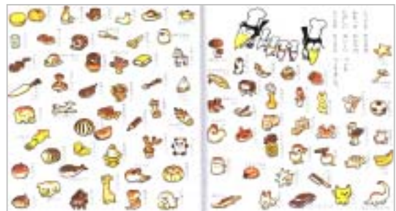
『からすのパンやさん』より 借成社 / 1973年

こうした幅広い人間性を背景とした加古絵本の魅力を紹介し、大人も子どももその世界を楽しんでいただきたいと思います。