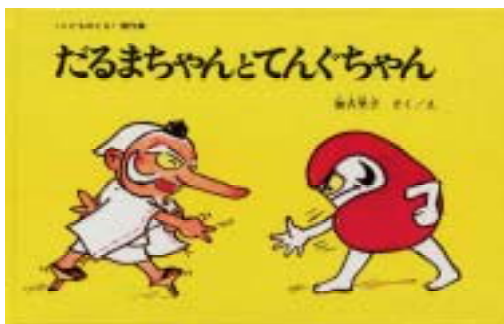
福音館書店 / 1967年

絵本作家・加古里子(かこ・さとし)さんは1926(大正15)年3月31日、国高村に生まれ、8歳までを武生町(ともに現越前市)で過ごしました。その後、東京大学在学中から社会救済活動(セツルメント活動)などを通じ、子どもたちと接しながら、紙芝居・科学絵本などの製作にあたり、1959年(昭和34年)『だむのおじさんたち』を発表し、絵本作家としての道に進みました。以来40数年間に500点以上の作品