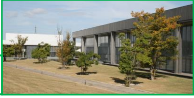
前庭(植栽) アラカシ、ケヤキ