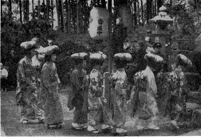
八人の女臈たち。