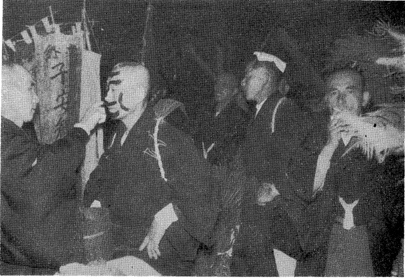
加茂神社の張屋に幕をはりめぐらし、うす暗い中で神役三人の扮装が、ジंकをうたいながら始まる。