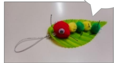
▲あおむしストラップ