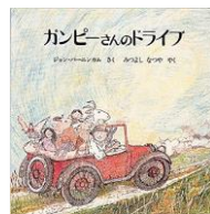
『ガンビーさんのドライブ』 ジョン・バーニングガム 作 みつよし なつや 訳 ほるぷ出版 1978.4