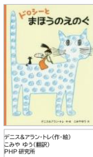
デニス&アンソニー(作・絵) こみやゆう(翻訳) PIPI 研究所