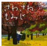
東直子・作 木内達朗・絵 くもん出版 2013. 9